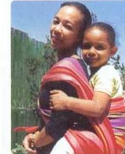
à la chinoise