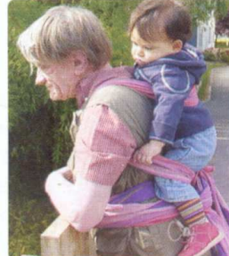
à la tibétaine